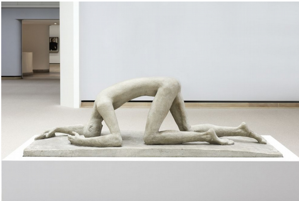
© Wilhelm Lehmbruck, Le Crashed , 1915, Staatsgalerie Stuttgart

À partir de sa vaste collection, l'exposition à la Staatsgalerie explorera la façon de travailler de Wilhelm Lehmbruck et présentera des variations de ses sculptures les plus importantes, telles que « der Große Sinnende », « der Emporsteigende Jüngling », « die Große Stehende » ou « die Kniende ».