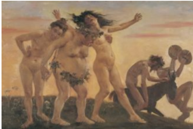
© Lovis Corinth, Heimkehrende Bacchanten , 1898, Kunstmuseum Stuttgart