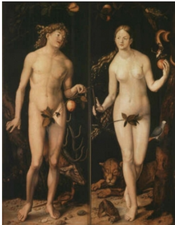
© Hans Baldung Grien, Adam & Eve

La fusion des importantes collections de Karlsruhe avec des emprunts internationaux de premier ordre a pour but de présenter le travail de l'artiste de la manière la plus complète possible.