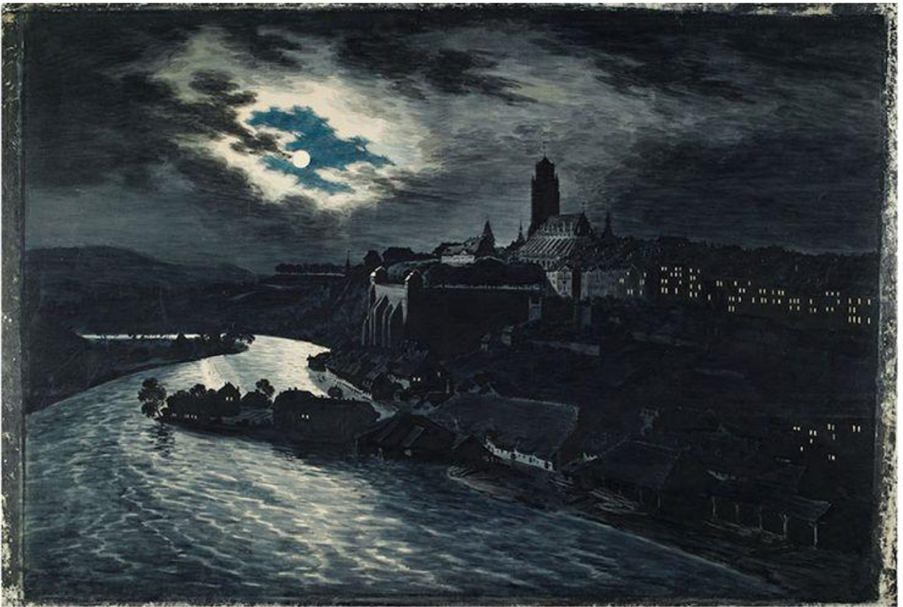
Aquarelle de Franz Nicklaus König