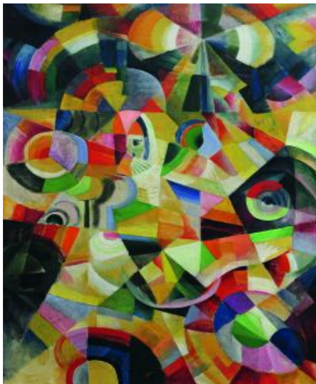
œuvre de johannes Itten

En cette année centenaire du Bauhaus qui fut fondé en 1919, le Kunstmuseum Bern consacrera au grand artiste suisse et enseignant du Bauhaus, Johannes Itten, une exposition qui s'intéressera pour la première fois à son projet utopique de parvenir à une fusion totale de l'art et de la vie. Elle sera essentiellement constituée des journaux et carnets d'esquisse d'Itten qui ont récemment fait l'objet de recherches inédites et dont ce sera la première présentation de grande ampleur. Associés à des œuvres clés de l'œuvre picturale de l'artiste, ils permettront de jeter un regard nouveau sur son exploration dessinée du monde et ses méthodes de création.