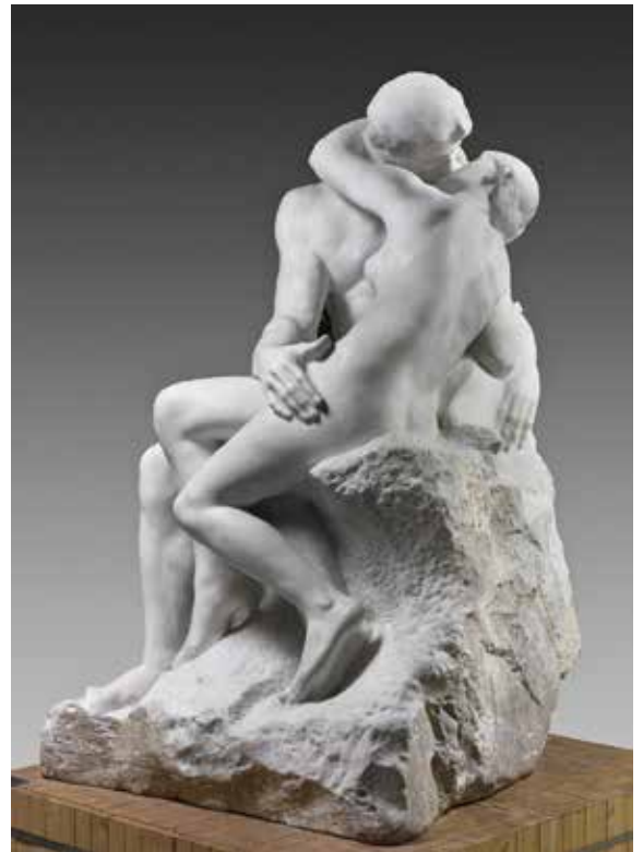
Auguste Rodin, Le baiser , Vers 1882