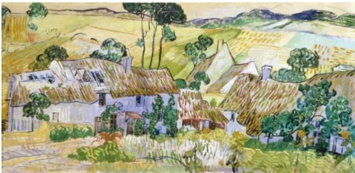
VanGogh La Ferme de Jorgus

« Sur les pas de Van Gogh » et de son "maître" Daubigny, accordez-vous le plaisir d'une promenade dans le village d'Auvers-sur-Oise, véritable musée à ciel ouvert, osez cheminer à travers "les tableaux" des champs de blé jusqu'au cimetière où reposent Vincent van Gogh et son frère Théo. Puis entrez dans l'intimité des lieux de vie des trois artistes majeurs du village : la Maison Van Gogh, la maison du Docteur Gachet, la maison atelier de Daubigny et de son fils Karl dans le tout nouvel espace qui leur est consacré