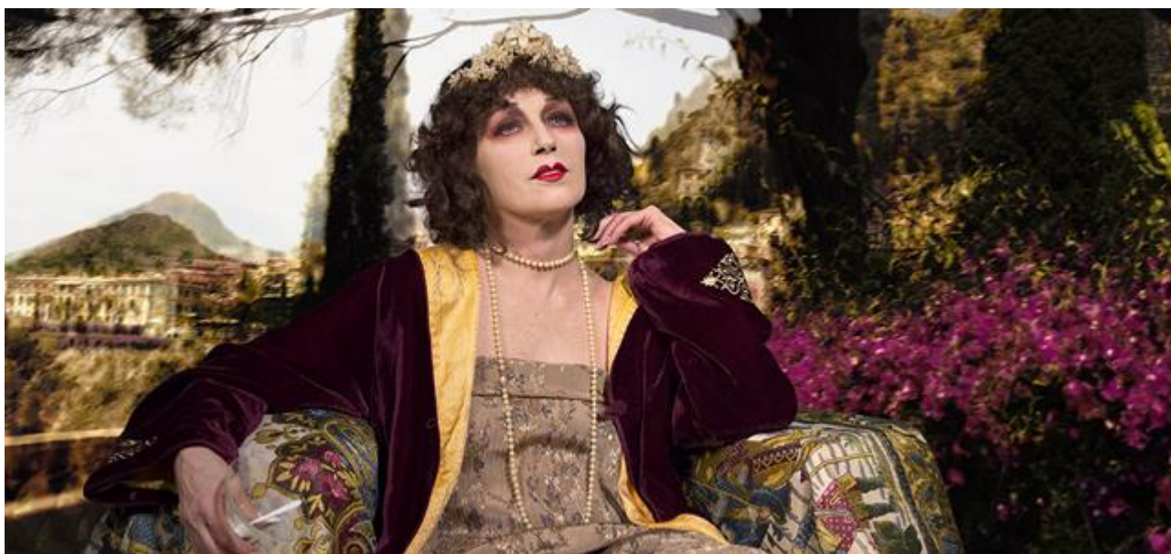
Cindy Sherman. Untitled #582 (détail), 2016. Courtesy of the artist and Metro Pictures, New York © Cindy Sherman 2019

Parallèlement à cette rétrospective, la Fondation propose une nouvelle présentation de La Collection, Crossing Views , une sélection d'œuvres de la collection de la Fondation choisies en dialogue avec Cindy Sherman elle-même. En écho à son œuvre, le parcours est centré sur le thème du portrait et ses interprétations à travers différentes approches et médiums : peinture, photographie, sculpture, vidéo, installation. L'exposition réunit quelque vingt artistes français et internationaux , de générations et d'horizons différents, autour d'une soixantaine d'œuvres , dont nombreuses n'ont encore jamais été montrées à la Fondation.