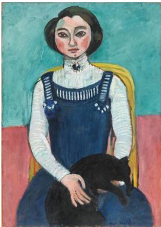
Henri Matisse, Marguerite au chat noir , 1910

signes qu'il aura introduits dans le langage plastique. » Durant toute sa carrière, il est cet artiste. Comme tous les grands créateurs, il donne naissance à des mondes sans équivalents – ces nouveaux signes plastiques qu'il appelle de ses vœux. Son œuvre, destiné à bouleverser le regard moderne, s'est exprimé au travers d'une variété de techniques qu'il a approfondies infatigablement : peinture, dessin, sculpture, livres illustrés, et jusqu'à cette invention singulière, riche de conséquences sur le plan artistique, d'un dessin à même la couleur, avec les gouaches découpées réalisées à la fin de sa vie.