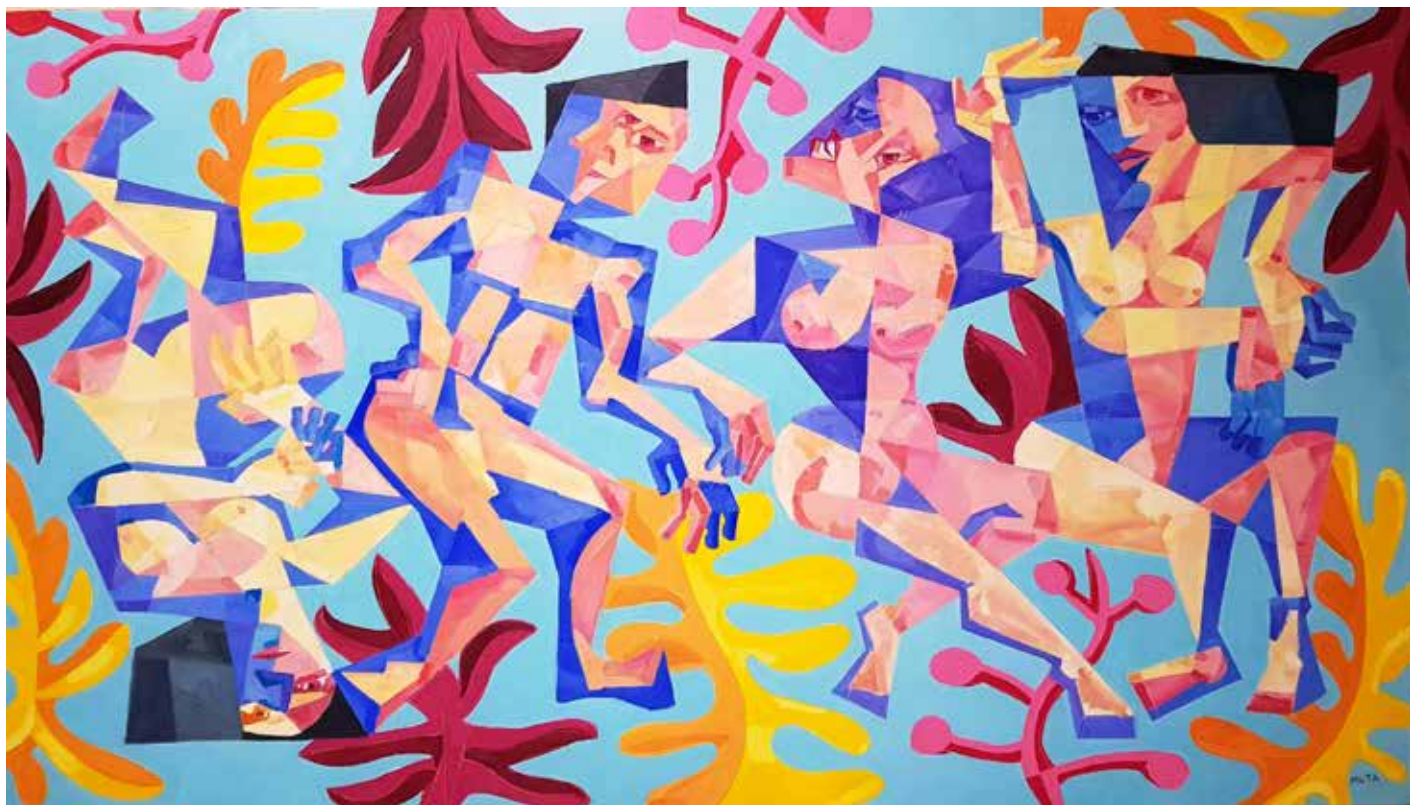
Le chassé du paradis Acrylique sur toile

« Dans mes œuvres, réalisées dans l'esprit du néo-cubisme, je cherche la profondeur de l'âme. [...] Avec le temps je me suis aperçu que dessiner de cette manière me permettait de mieux réunir mes forces matérielles et spirituelles afin de réaliser un tableau. Cela me permet de dépasser les dogmes classiques et réguliers, mais aussi de percevoir le contact de la couleur et de l'esprit. Dans mes toiles, le visage est à la fois miroir et masque. Je fixe l'existence qui s'arrête à côté de moi ; les personnes et leurs relations comiques, leurs regards ironiques. Mes œuvres expriment mes sentiments et mon souhait de partager avec le spectateur la beauté de l'instant. »