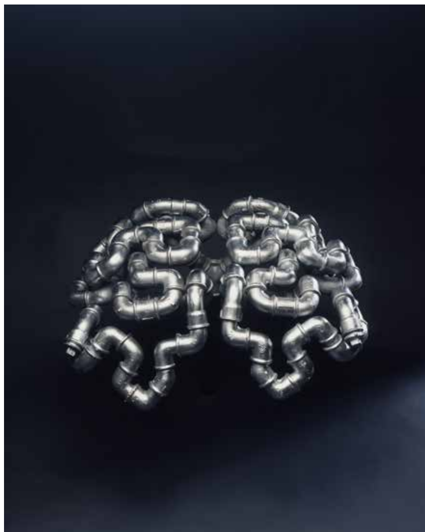
Esprit large et brillant Raccords de fonte malléable en 3/4''

«C'est le besoin de fabriquer à l'imitation d'un papa bricoleur et imprégné de ses livres techniques puis d'études d'industrie chimique qui me fit imaginer des machines et des réseaux absurdes délirants et inutiles. Puis, vingt ans plus tard, par un concours de circonstances et avec une invitation à oser relever un défi, j'entrepris de réaliser ce que j'avais imaginé.»