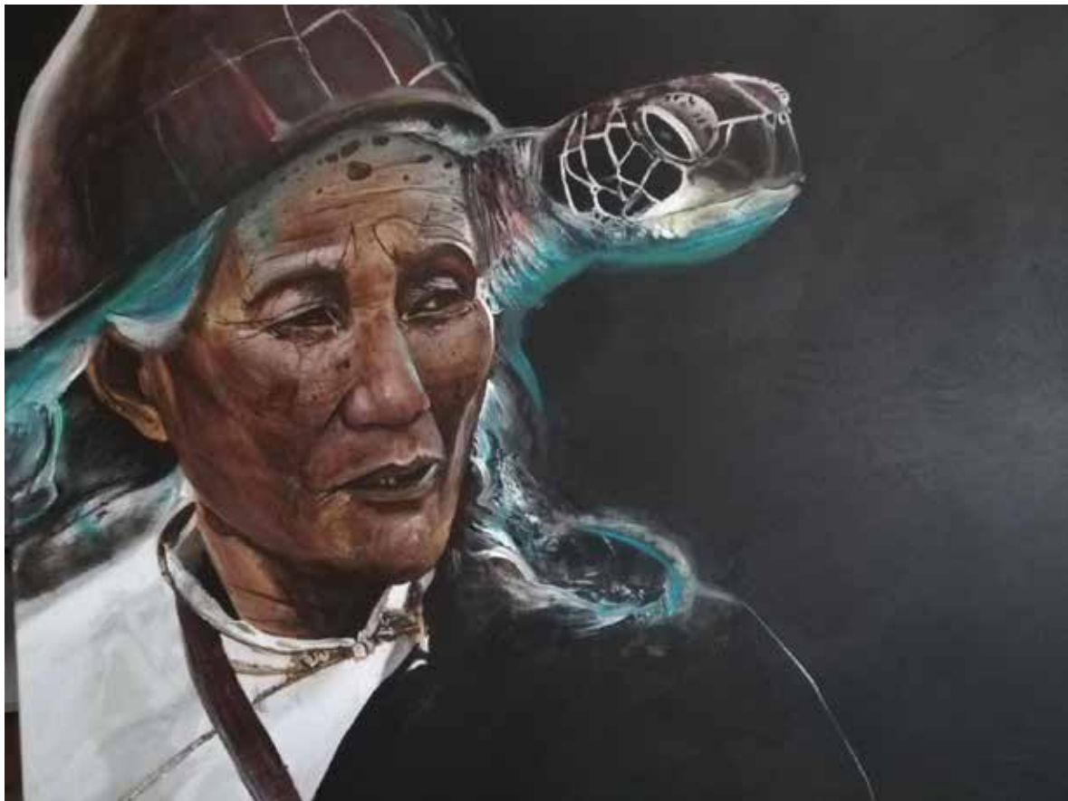
Sous la carapace Acrylique sur toile

«A bien des égards un mur peut symboliser ou matérialiser un obstacle, une frontière, une barrière; pour moi il a été un point de départ artistique. J'avais 6 ans et la rencontre avec cette surface immaculée a été pour moi le théâtre d'une expérience intrinsèque et sensuelle dans le monde de la peinture, surtout et avant tout la possibilité de représenter le monde tel que je le voyais avec mon regard d'enfant.»