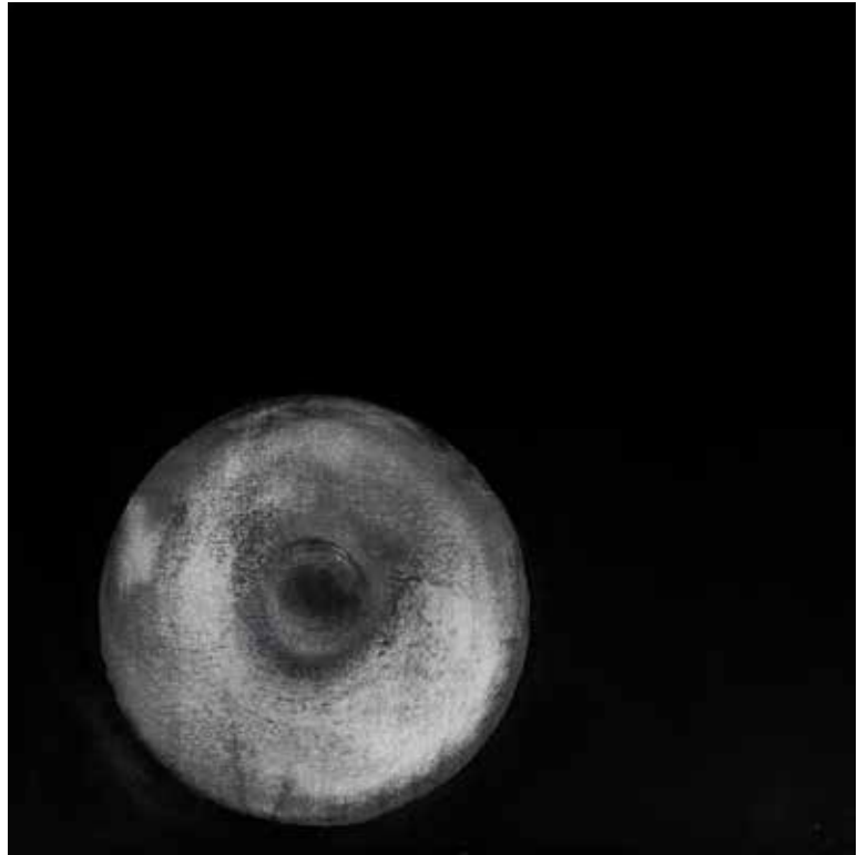
«Sans titre» A/T 18/23.1 (Mémoire de vent) Acrylique sur toile

Techniquement il faudrait plutôt parler de «dé-peinture»*: en effet la technique consiste à martyriser la toile jusqu'à faire apparaître ici "glaçure", là "marbrure", là-bas "moirure" ou "grisaille". Ce mode opératoire issu de l'industrie du bâtiment n'existant pas sur toile pour cause de fragilité du support, est unique et «original». Le procédé même maîtrisé reste brutal et aléatoire.