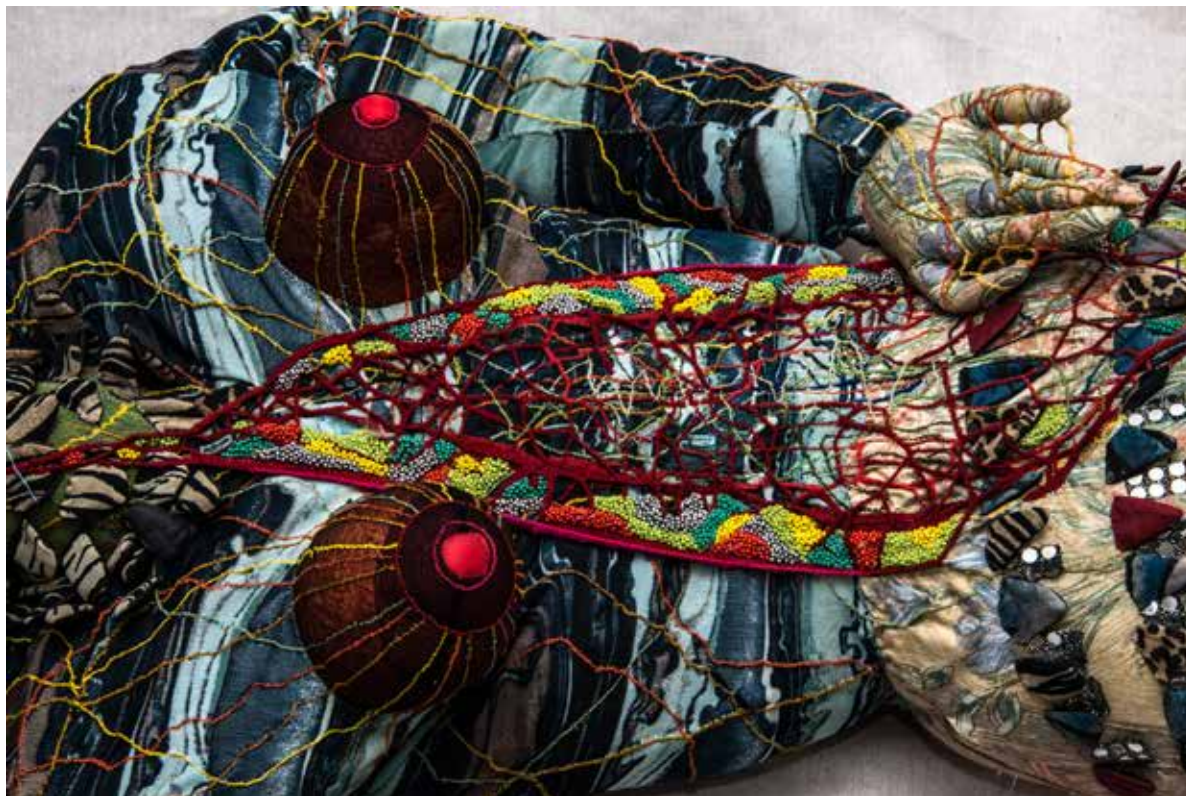
Avoir de jolies jambes (détail) Sculpture textile

« La première fois que j'ai pris une aiguille et du fil, je travaillais alors en usine. J'y récupérais les charlottes et les masques de protection que j'assemblais. Naissaient alors de petites pièces fragiles comme ma démarche artistique à la sortie de la HEAR.